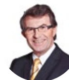
Franz Piribauer, MSc Kulturstadtrat

Abseits der aktuellen Filmindustrie gibt es Klassiker, die jede Altersgruppe kennt und schätzt und die seit ihrer Produktion keineswegs an Wert verloren haben. Mit der Veranstaltungsreihe im Bürgermeistergarten präsentieren wir Filmkunst, die Generationen verbindet und somit zum absoluten Familienereignis wird. Ich wünsche gute Unterhaltung im urbanen Flair unserer Stadt und viel Vergnügen mit der dargebotenen Filmauswahl.